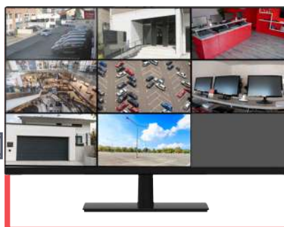
Moniteur Ici M0122