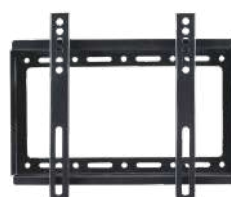
Support mural en option SP702