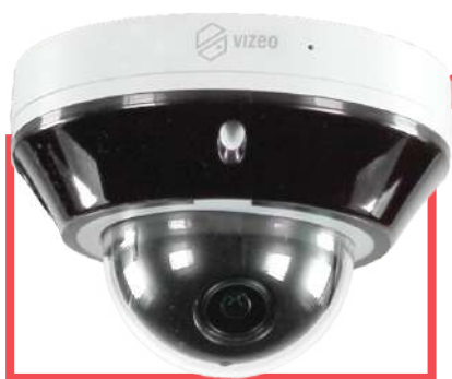
Caméra Vizeo Ici DA350PAP

Pour consulter vos caméras sans enregistrer, il n'est pas nécessaire d'avoir un enregistreur, un switch PoE suffit.