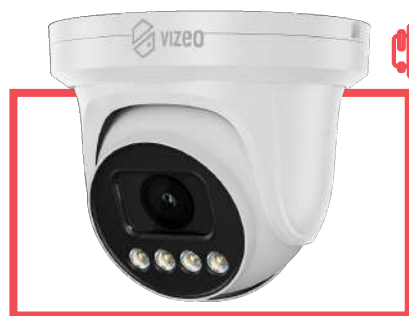
Caméra Vizeo Ici DA350PAP